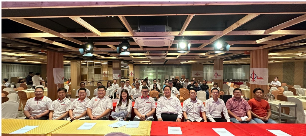
10 June 2023