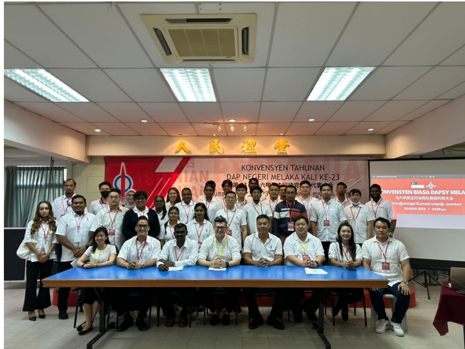
20 Ogos 2023