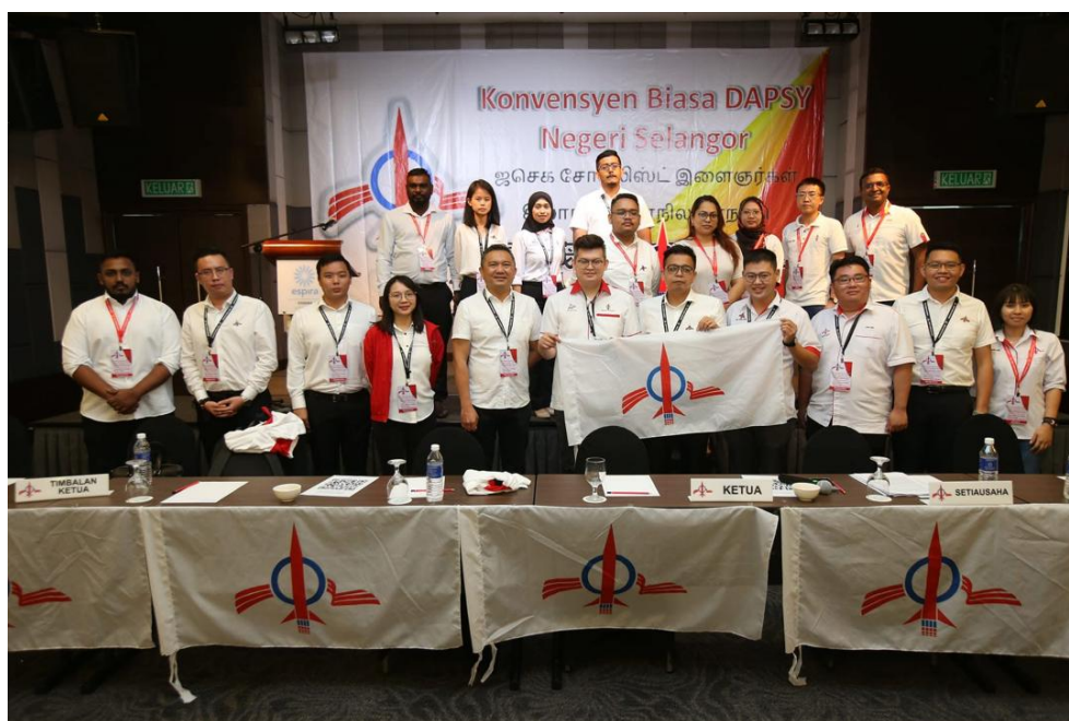
12 June 2022