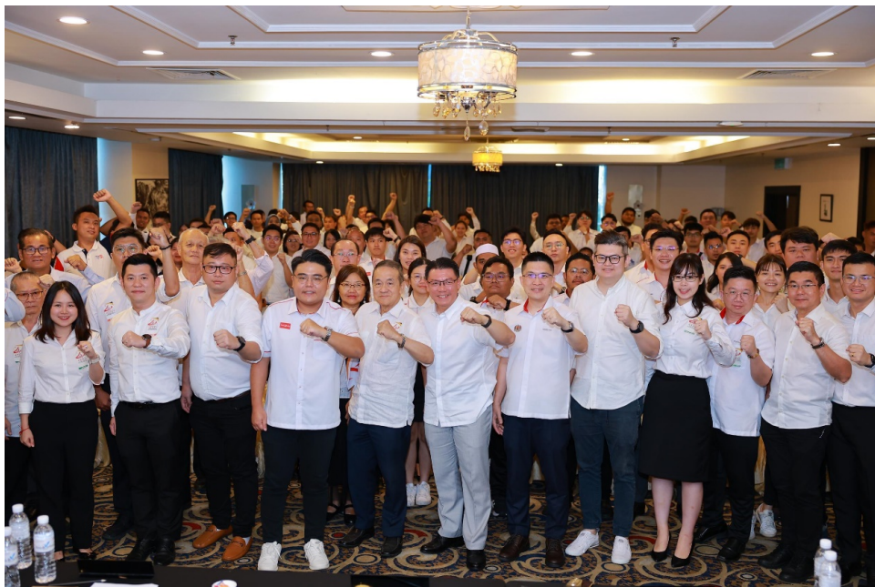
29 September 2024